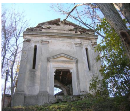
CHIESA DI CARESTE