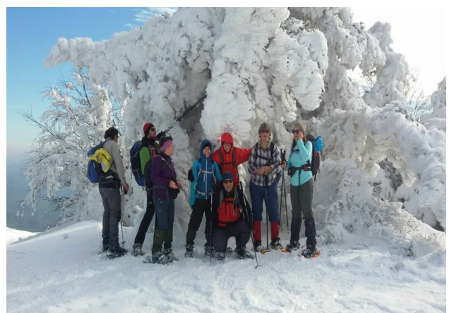
Loro hanno fatto un assaggio. Speriamo che sia così anche il 10 Gennaio