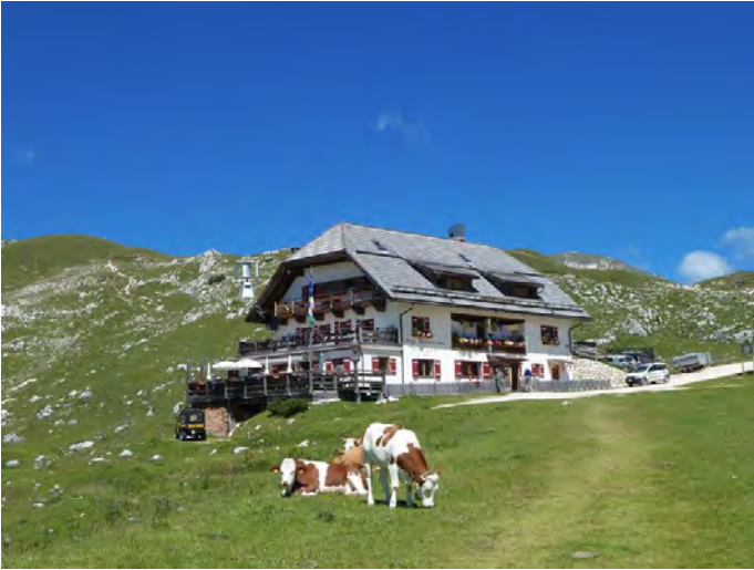
Croda del Becco