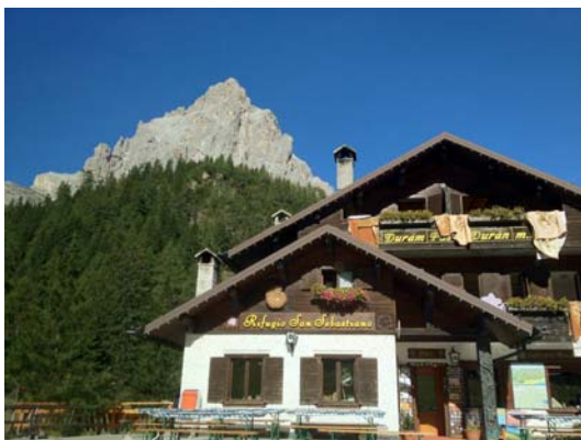
Rifugio San Sebastiano