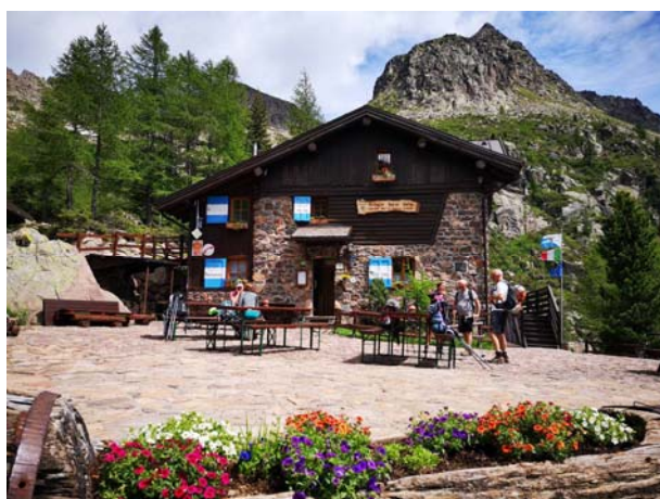
Rifugio Sette Selle