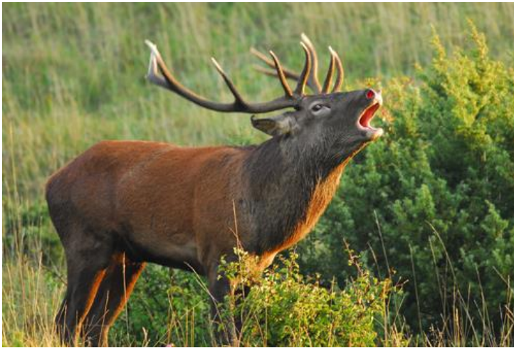
Subadulto di cervo in bramito