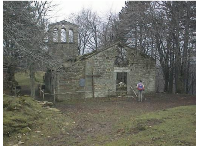
Resti della chiesetta di San Paolo in Alpe

Escursione serale che ha come obiettivo l'ascolto dei bramiti dei cervi, che in questa stagione appunto lanciano i loro richiami amorosi. E, se saremo fortunati, forse potremo anche osservare sua maestà il cervo.