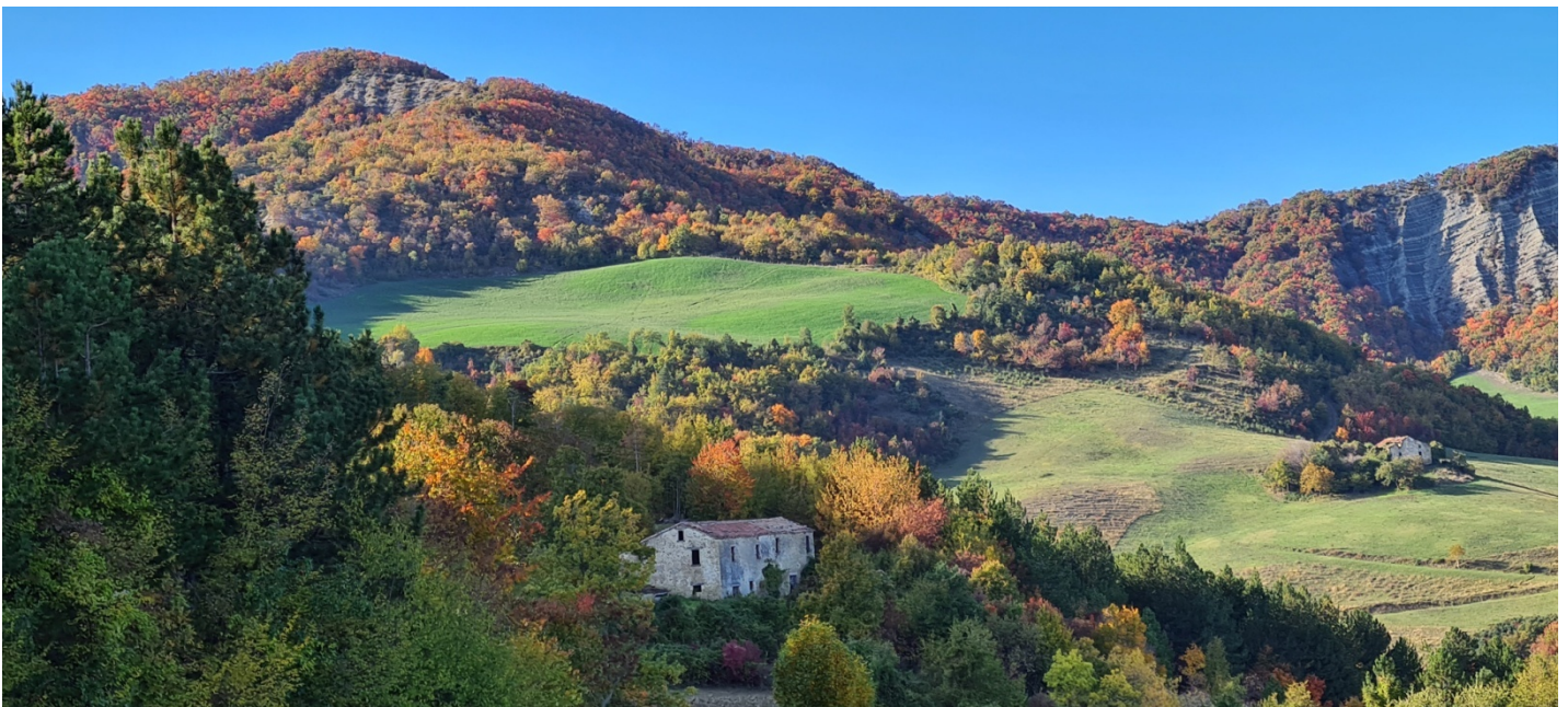
A sinistra Monte Facciano e seguendo il crinale, a destra, Monte Vecchio con la rupe di marna arenaria. Più in basso, i prati ed i ruderi del percorso di ritorno.

Escursione circolare, con partenza dal parcheggio del centro Erboristico REMEDIA (Cà Francioni 515 m, Quarto di Sarsina) . Si percorre in salita, la strada bianca panoramica (con vedute verso Perticara, San Marino, Carpegna, Monte Fumaiolo) fino ad un altipiano (Cà del Monte 692m.), adibito a pista di atterraggio di aerei ultraleggeri. Da qui, parte il sentiero (CAI 109), in costante salita nel bosco fitto, Si arriva in cresta sul crinale, nella zona denominata Montalto, dove nel 1812 si staccò una parte del monte, causando la frana che travolse le abitazioni di Quarto, provocando la morte di molti abitanti. La stessa frana, ostruendo l'alveo del fiume Savio, diede origine all'omonimo Lago di Quarto. In memoria degli abitanti caduti, in cima al Montalto è stato eretto un Cippo. Nel lago è attiva una centrale idroelettrica. Ora il sentiero corre in falso piano, fino ad arrivare ad un bellissimo punto panoramico (sella 823 m), che permette la visuale nella sottostante vallata del fiume Savio. Ora dopo avere superato la selletta, il percorso incrocia altri sentieri provenienti dal basso: si prosegue dritto, in costante salita fino alla cima del Monte di Facciano (902 m. punto panoramico) ed al suo omonimo rudere. Da qui, partono diversi sentieri: dritto (CAI 113) per la dorsale Monte Mescolino-Rullato ed il nostro, a destra, denominato SP, che percorre la dorsale di Monte di Facciano – Careste (Sarsina).